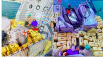
Imágenes de una patrullera marroquí, cargada de droga, ejerciendo de "nave nodriza" para narcolanchas.

https://www.elmundo.es/andalucia/2024/03/13/65f09569e4d4d8600c8b456e.html